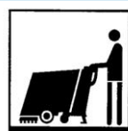
Produit pour l'entretien à l'aide d'une autolaveuse