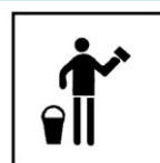
Produit pour le nettoyage des murs et surfaces