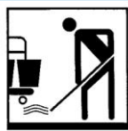
Produit pour le nettoyage manuel des sols