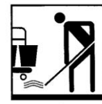
Produit pour le nettoyage manuel des sols