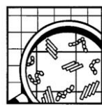
Produit pour la désinfection des sols et surfaces