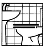
Produit pour l'entretien des sanitaires