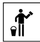
Produit pour le nettoyage des murs et surfaces